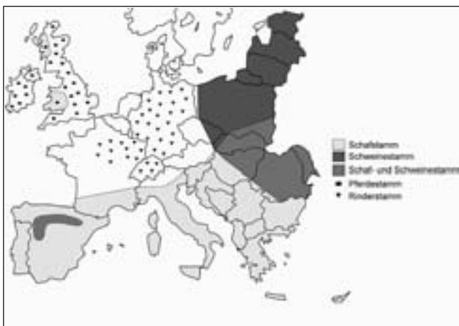
Abbildung 2: Approximative Verbreitung von E. granulosus in Europa (ausgefüllte Felder entsprechen einem endemischen, Punkte einem sporadisch/punktuellem Vorkommen, modifiziert nach Romig et al. [2006]).

men in Südeuropa, 14% wurden im Ausland zugekauft, 14% privat aus zweiter Hand und nur 4% von ausländischen Züchtern erworben. Interessant war die Tatsache, dass 28% dieser Hunde beim Erwerb ab Tierheim bereits an Leishmaniose erkrankt waren (Mettler et al., 2005a). Die geographische Verbreitung