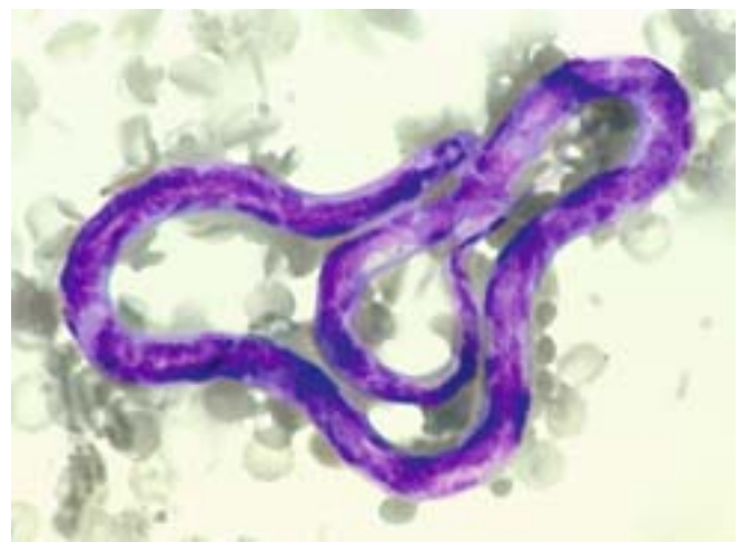
Abbildung 5: Mikrofilarie von Dirofilaria spp. im Blutausstrich, Giemsa-Färbung.

Die mittleren Temperaturen in den Sommermonaten reichen in verschiedenen Teilen des Tessins aus, um eine autochthone Übertragung von Dirofilarien durch Stechmücken zu ermöglichen (Genchi et al., 1998; Genchi et al., 2005). Tatsächlich konnten im Tessin vereinzelt sowohl Dirofilaria immitis als auch D. repens bei Hunden nachgewiesen werden. Bei einigen dieser Fälle wurden auch autochthon erfolgte Übertragungen vermutet (Bucklar et al., 1998; Petruschke et al., 2001). Interessanterweise liess sich jedoch in den letzten Jahren keine Häufung von autochthonen Fällen im Tessin oder dem angrenzenden Norditalien dokumentieren (C. Genchi und F. Naegeli, persönliche