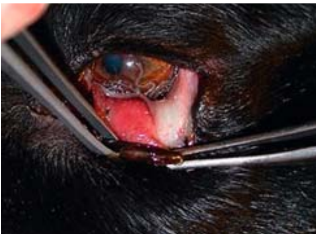
Abbildung 6: Adulte Thelazia callipaeda im Auge eines Hundes.

Der Augewurm Thelazia callipaeda (Abb. 6), ein Nematode, befällt in der Regel Hunde, gelegentlich aber auch andere Caniden, Katzen, Kaninchen und selten auch den Menschen. Dieser Parasit ist vor allem im Fernen Osten verbreitet (Russland, China, Japan, Indien u.a.). Er wurde aber kürzlich mit hoher Prävalenz bei Hunden in Süditalien (bis zu 42%) und Norditalien (23%) sowie bei Füchsen (5%) nachge-