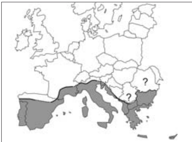
Abbildung 1: Nördliche Endemiegrenze der caninen Leishmaniose ( L. infantum ) (—: dokumentierte Fälle [Trotz-Williams und Trees, 2003; Vêlo et al., 2003; Amusatégui et al., 2004; Papadopoulou et al., 2005; Zivicnjak et al., 2005] und persönliche Mitteilungen [Mazedonien: M. Schnyder; Bulgarien: B. Gottstein]); .....: vermutete Grenze.

einem Diskussionsforum im Internet BesitzerInnen von Hunden im deutschsprachigen Raum (D, A, CH) zur Vorgeschichte ihres Tieres befragt wurden. Von 111 Hunden, die im Leishmania-Test seropositiv waren, handelte es sich bei deren 103 um Importhunde und nur bei 8 um reisebegleitende Hunde. Die Mehrzahl der seropositiven Hunde stammte aus Spanien (67%), die übrigen aus Italien, Frankreich und Griechenland. Von 95 seropositiven Hunden stammten 47% aus deutschen Tierheimen, 21% aus Tierheimen